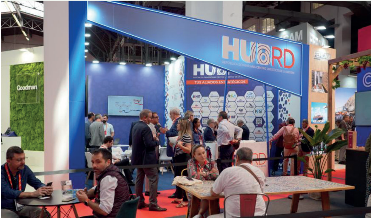
Fachada del stand del HubRD que representó a República Dominicana en la SIL Barcelona 2023.