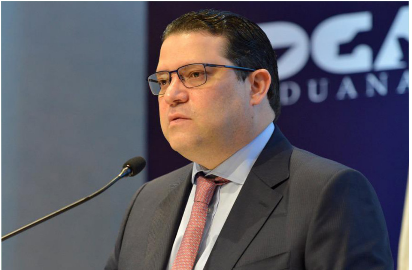
El director general de Aduanas, Eduardo Sanz Lovatón, reafirmó su compromiso de continuar fortaleciendo las aduanas con esas certificaciones.

La norma sobre la prestación y automatización de los servicios públicos del Estado dominicano tiene como propósito la normalización, homogeneización, y automatización de todos los servicios del Estado dominicano, estableciendo para esto las directrices de control, las cuales garanticen su eficiente gestión y aseguren la calidad, disponibilidad y continuidad de estos, conforme a los diferentes canales de prestación, en especial, aquellos en línea.