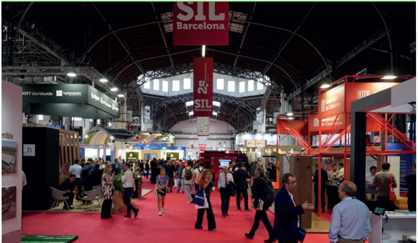
La feria volvió a convertirse en la más concurrida celebrada en Barcelona para el sector logístico.