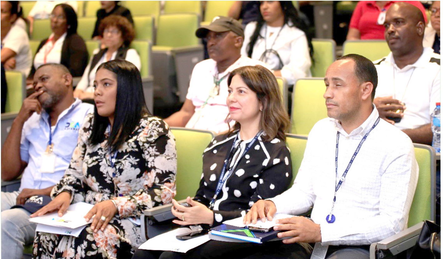
Funcionarios de la DGA estuvieron apoyando a los colaboradores que decidieron ir a la charla para continuar con sus estudios.