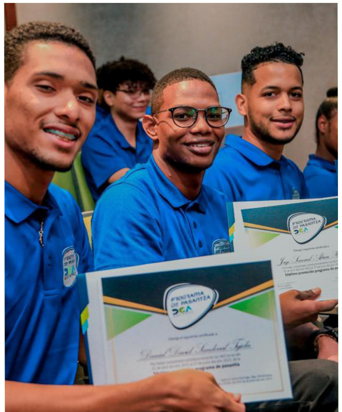
Algunos de los pasantes que fueron reconocidos durante la actividad.