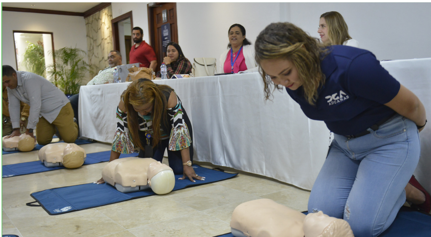
Desde varias administraciones, llegaron colaboradores para tomar el taller que los forma para dar primeros auxilios.