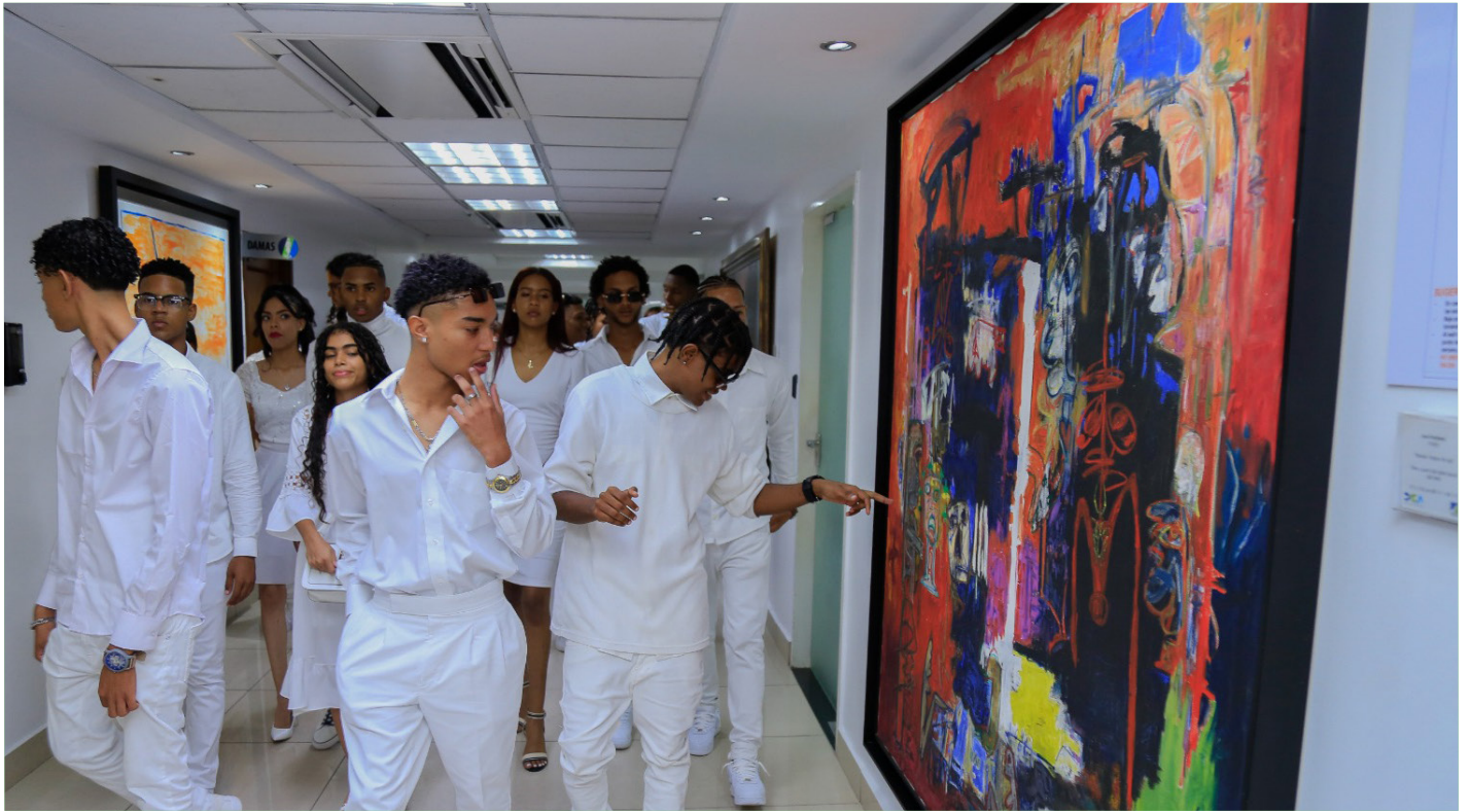
Estudiantes del Instituto Tecnológico de las Américas (Itla) y Universidad Autónoma de Santo Domingo (UASD), observando en los pasillos de Aduanas, las obras de artes, en este caso "Mundo mágico de Jad" pintada por el artista José Perdomo (Año 1943).