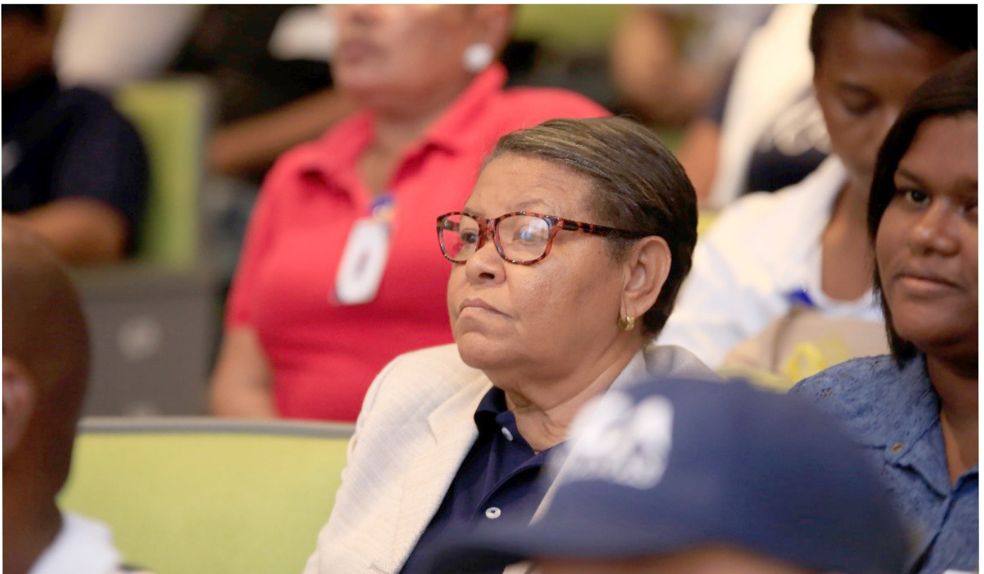
Parte de los colaboradores de Aduanas estuvieron presente en la charla.