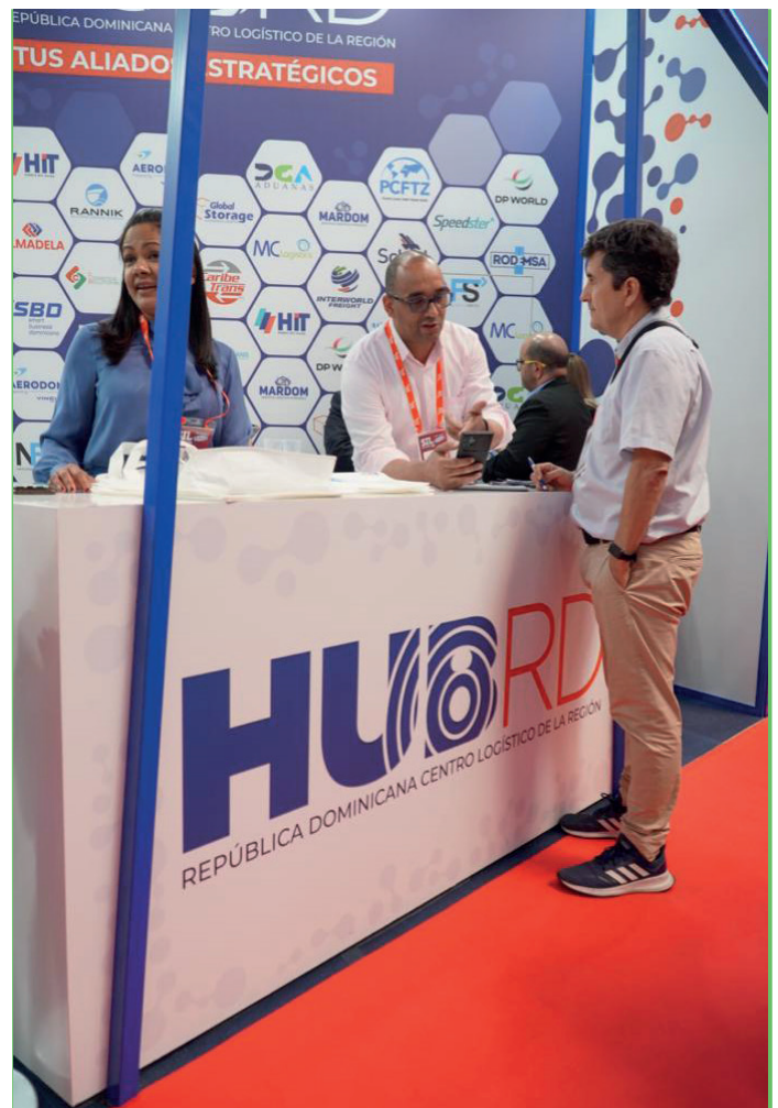
Parte del público asistente a la feria aprestándose a buscar información en el stand dominicano.

En cuanto a conectividad, República Dominicana cuenta con 8 aeropuertos internacionales, 40 aerolíneas operando en el país, 320 vuelos diarios, 150 conexiones a ciudades de todo el mundo y 9.600 vuelos internacionales mensuales.