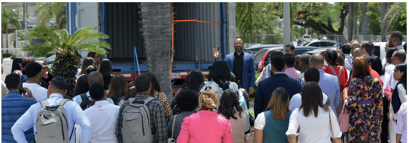
Colaboradores prestando atencin a las explicaciones de la parte prctica del taller.