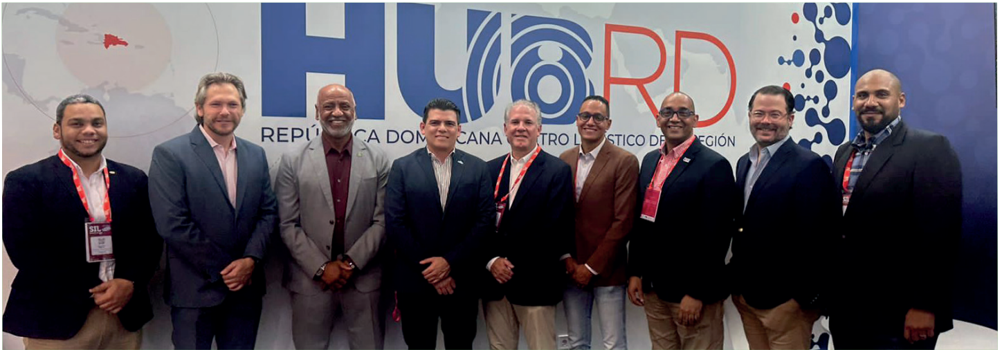
Funcionarios de la DGA, empresarios del Sector Privado y miembros de Asologic junto al embajador dominicano en el Reino de España, Juan Bolívar Díaz.

nivel logístico. “Hemos sido reconocidos por el tema turístico pero también este es el momento de esta nueva parte de la economía”, como es la logística y la manufactura, ha destacado.