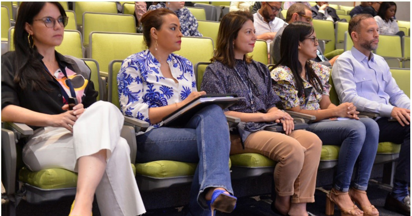
Funcionarios de Aduanas, escuchan atentos los resultados obtenidos por la misión de Corea en DGA.