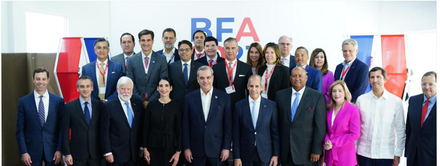
El presidente de la República, Luis Abinader y su esposa Raquel Arbaje posan junto a las personalidades que estuvieron presentes en la conferencia "Business Future of the Américas".

158 indicadores dinámicos. Asimismo, reveló los resultados que ha arrojado el programa Despacho en 24 Horas (D24H), a través del cual se han procesado más de 40,000 contenedores en un plazo de 24 horas o menos, en beneficio de más de 6,257 importadores, de los cuales el 68 % son pequeñas y medianas empresas (PYMES).