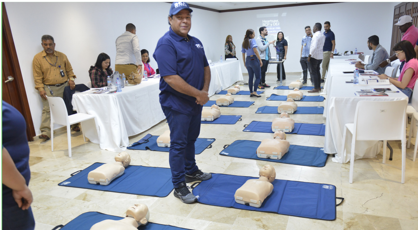
Los colaboradores que estuvieron presentes en el taller de primeros auxilios dado en la sede central de Aduanas.