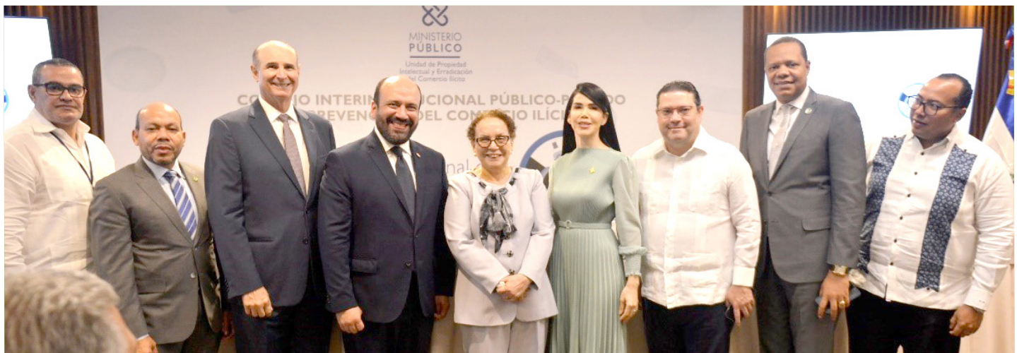
En un ambiente muy ameno se llevó a cabo la conferencia sobre “Comercio Ilícito”, organizado por el Consejo Público-Privado.