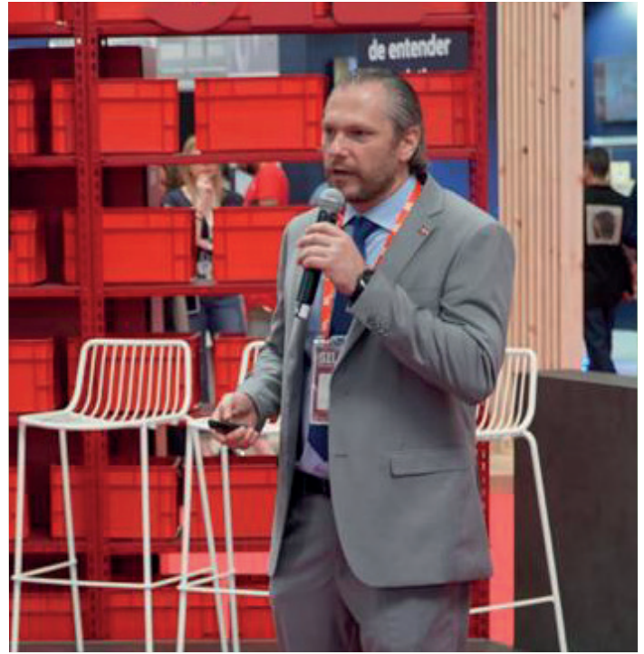
El subdirector de Aduanas, Johannes Kelner.

En SIL Barcelona 2023 participan más de 6 mil personas, y lleva 25 años realizándose. En el marco del SIL 2023, sumando sinergias con el SIL KNOWLEDGE, se llevarán a cabo 4 grandes congresos internacionales que reunirán a los expertos más destacados en logística: El 39.º Congreso ALACAT, la 18.ª European Conference & European Research Seminar del CSCMP, la 19.ª MedaLogistics Week y la 26.ª edición de EUROLOG.