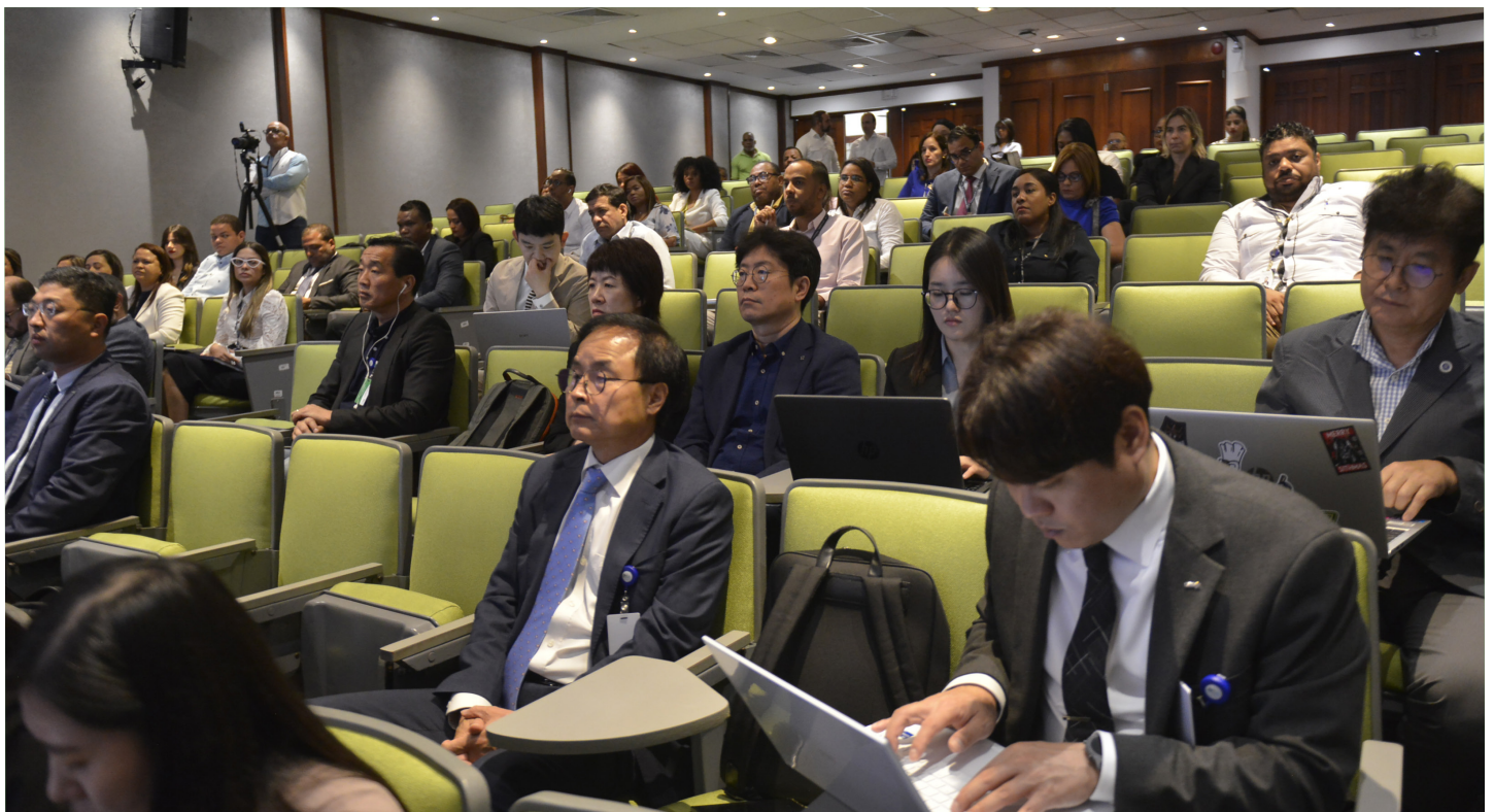
Parte de los asistentes en el acto de recibimiento de la delegación de Corea que estuvo en la DGA.