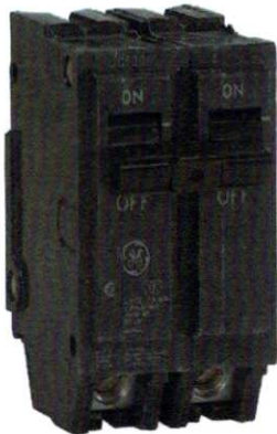
Imagen Para los ítems 22,23,24 y 25

Imagen para los Items # 26, 27, 28, 29, 30 y 31